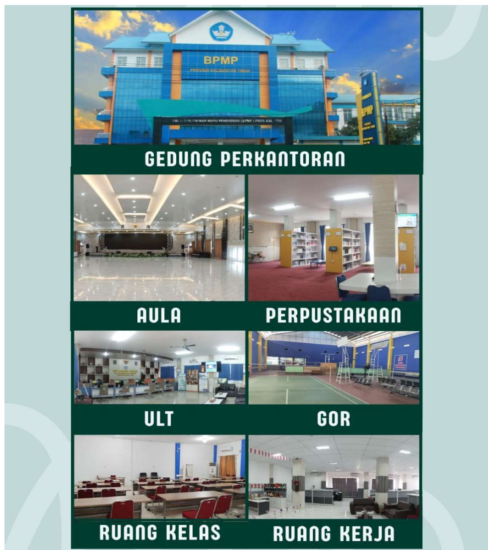
Gambar 3 Sarana dan Prasarana BPMP Provinsi Kalimantan Timur

Upaya pelayanan prima terus ditingkatkan melalui pengembangan gedung perkantoran, perpustakaan, ruang laboratorium, ruang aula, ruang kelas, asrama, lapangan olahraga dan sarana prasarana pendukung lainnya. Selain itu, jaringan internet sebagai pendukung teknologi informasi sudah menjangkau seluruh area gedung dalam rangka semakin memperkuat BPMP Provinsi Kalimantan Timur, dalam memberikan layanan bagi pelanggan. Penggunaan sistem teknologi informasi juga digunakan dalam Unit Layanan Terpadu (ULT) dengan berbagai layanan informasi dan konsultasi serta layanan pengaduan.