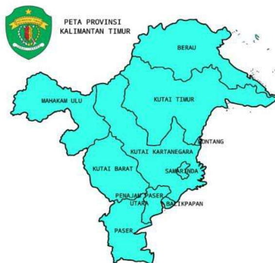
Gambar 2 Luas Wilayah Provinsi Kalimantan Timur

Provinsi Kalimantan Timur memiliki luas wilayah daratan 127.346,92 km 2 dan luas pengelolaan laut 25.656 km 2 . Rentang Geografis berada antara 113°44'-119°00' Bujur Timur dan antara 2°33' Lintang Utara sampai 2°25' Lintang Selatan. Provinsi Kalimantan Timur terletak di ujung timur Pulau Kalimantan dan berbatasan dengan beberapa wilayah, yaitu sebelah utara berbatasan dengan Provinsi Kalimantan Utara, sebelah selatan dan barat berbatasan dengan provinsi-provinsi kalimantan lainnya, sebelah timur berbatasan dengan laut. Provinsi Kalimantan Timur terdiri dari 10 Kabupaten/Kota, yaitu Kota Samarinda, Kota Balikpapan, Kota Bontang, Kabupaten Kutai Kartanegara, Kabupaten Penajam Paser Utara, Kabupaten Paser, Kabupaten Kutai Barat, Kabupaten Kutai Timur, Kabupaten Berau, dan Kabupaten Mahakam Ulu.